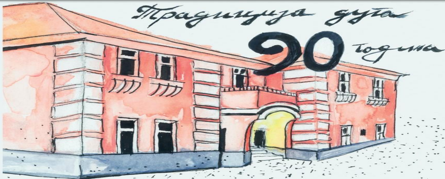
Дом ученика у Чачку, основан 1931. године